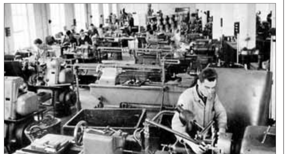
Maschinen in Reih' und Glied: So sah es 1954 in den Fertigungshallen der Münchner Schaltbau aus, die heuer ihr 75-jähriges Bestehen feiert.